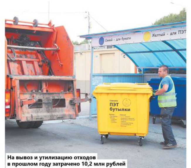
На вывоз и утилизацию отходов в прошлом году затрачено 10,2 млн рублей

1,7 млн рублей затрачено на украшение к новогодним праздникам, Дню защитника Отечества, 8 Марта, Дню Победы. Выполнены работы по изготовлению и размещению баннеров, установке флагов к празднованию Дня Победы и Дня города.