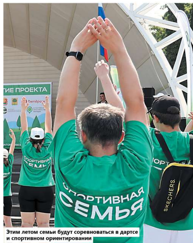
Этим летом семьи будут соревноваться в дартсе и спортивном ориентировании