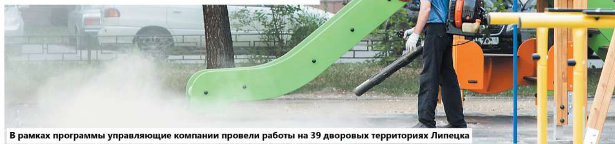
В рамках программы управляющие компании провели работы на 39 дворовых территориях Липецка

Претендовать на получение государственных субсидий не смогут фирмы-должники, иноагенты и те, кто платит своим сотрудникам зарплату ниже прожиточного минимума.