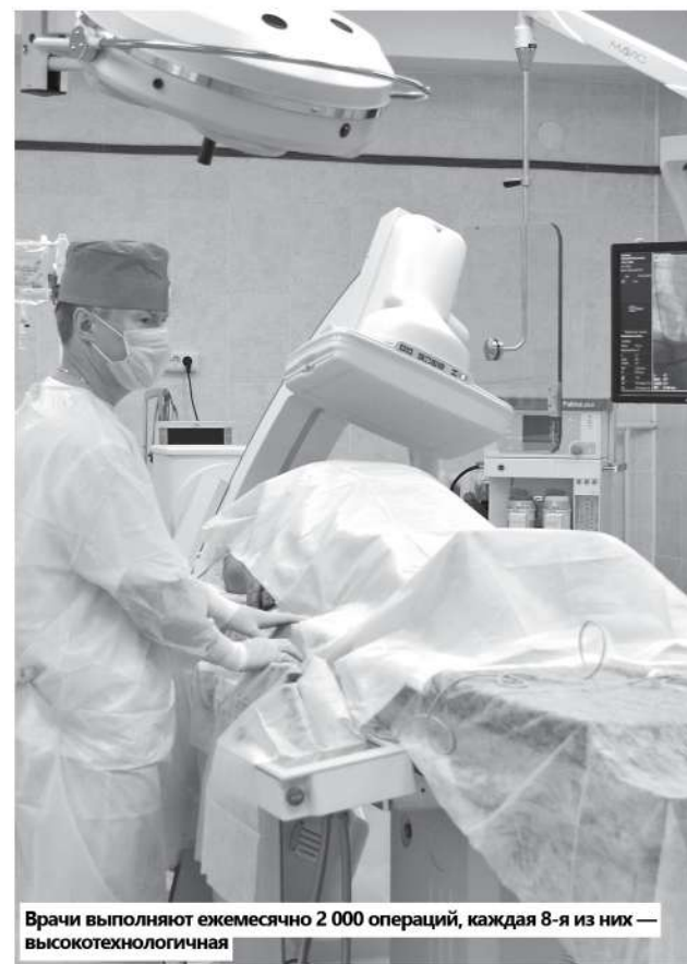
Врачи выполняют ежемесячно 2 000 операций, каждая 8-я из них — высокотехнологичная

Вся деятельность коллектива больницы направлена на то, чтобы медицинская помощь стала доступной, качественной и комфортной.