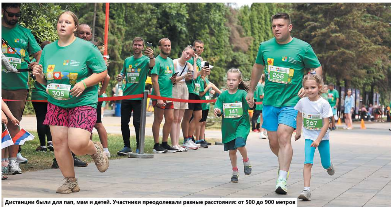
Дистанции были для пап, мам и детей. Участники преодолевали разные расстояния: от 500 до 900 метров