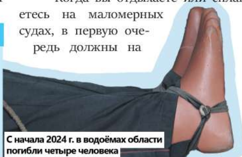
С начала 2024 г. в водоёмах области погибли четыре человека

В случае происшествия необходимо немедленно звонить по телефонам: 112 или 101, со стационарного телефона: 01. Единый «телефон доверия» Главного управления МЧС России по Липецкой области: 22-88-60.