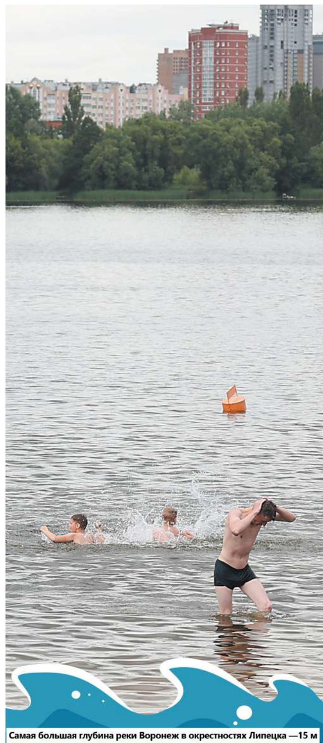
Самая большая глубина реки Воронеж в окрестностях Липецка — 15 м