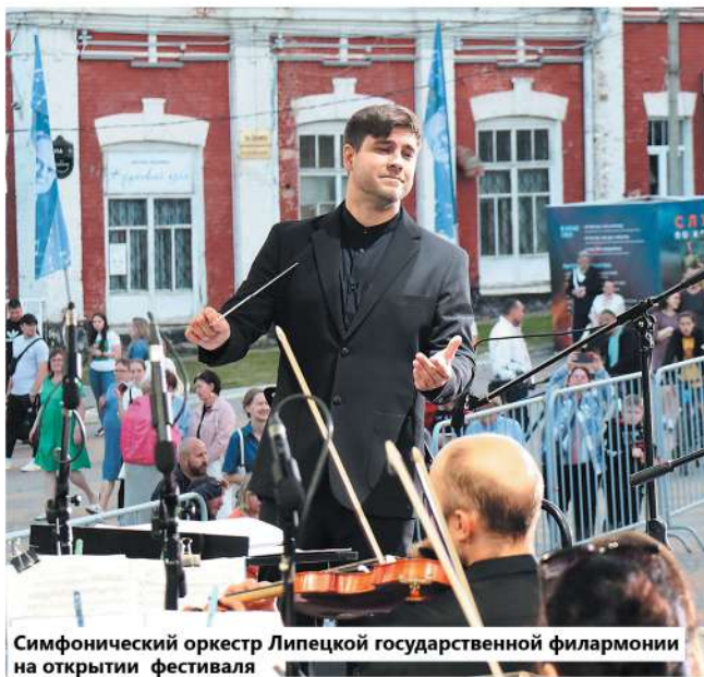
Симфонический оркестр Липецкой государственной филармонии на открытии фестиваля

Твёрдость духа, возможно, исходила от купеческих корней. Своих родителей Хренников называл шибаями.