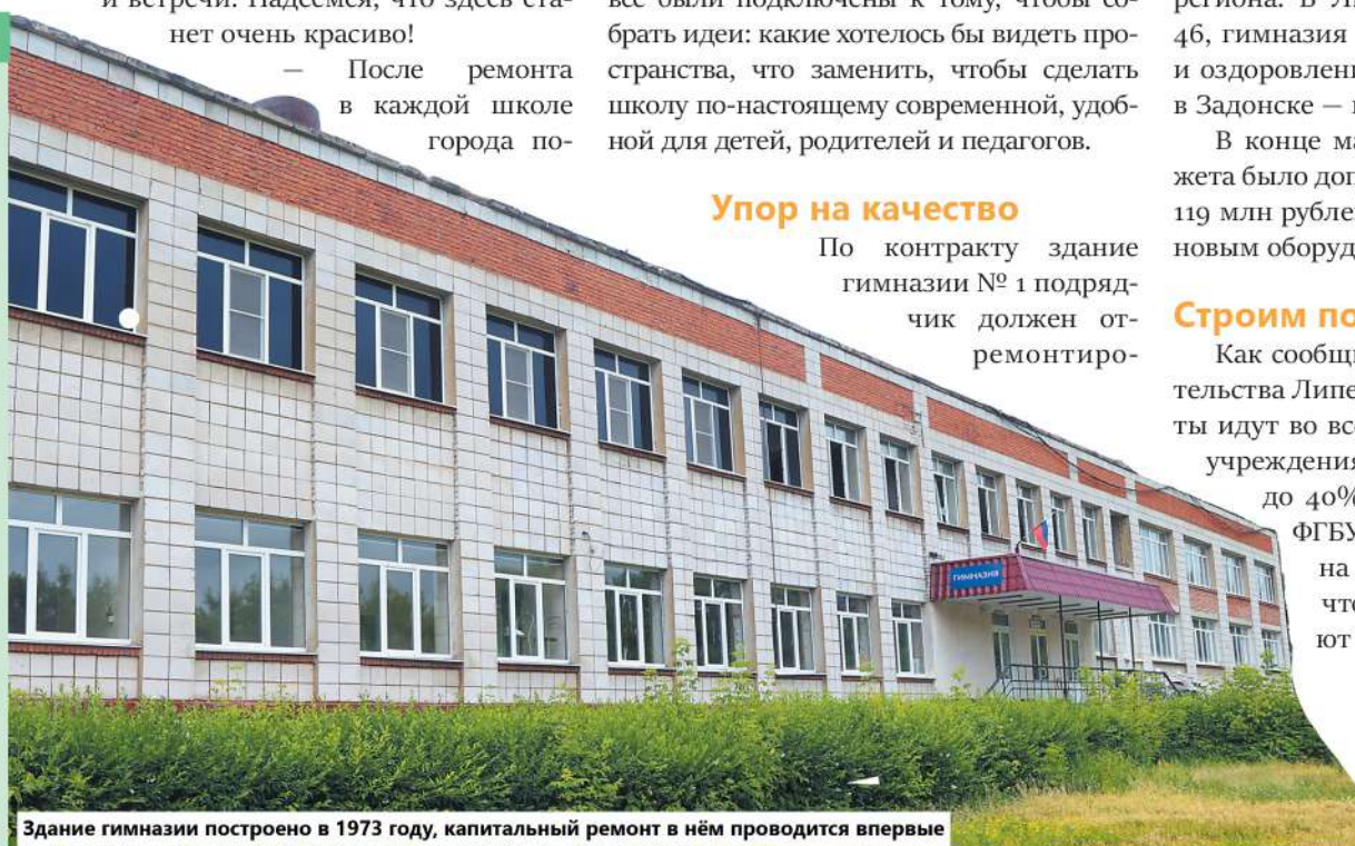
Здание гимназии построено в 1973 году, капитальный ремонт в нём проводится впервые

МБОУ «Гимназия № 1» г. Липецка — одно из старейших образовательных учреждений Липецка. Школа № 1 была открыта в 1871 году как женская гимназия. Её эмблема — изящная лавровая ветвь с тремя буквами — ЛЖГ (Липецкая женская гимназия). В 1918 году в помещении гимназии открывается смешанная школа 2-й ступени № 1 (девятилетка), а в 1925 году — школа с педагогическим уклоном. С 1931-го по 1934 год школа была фабрично-заводской. С 1934-го и до 1944 года — вернулась к своей «классике», снова стала девятилетней. В 1954 году она становится средней школой № 1. В 1973 году состоялось открытие нового здания школы № 1. В 1997 году школа № 1 вернула себе историческое название — гимназия.