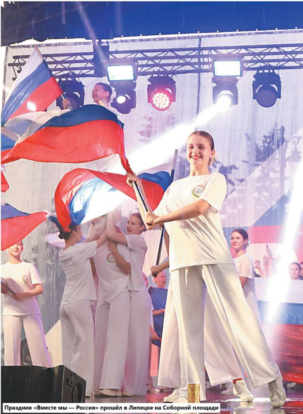
Праздник «Вместе мы — Россия» прошёл в Липецке на Соборной площади

НЕСМОТЯ НА ЛИВНЕВЫЕ ДОЖДИ, ЛИПЧАНЕ ИНТЕРЕСНО ОТМЕТИЛИ ДЕНЬ РОЖДЕНИЯ РОДИНЫ