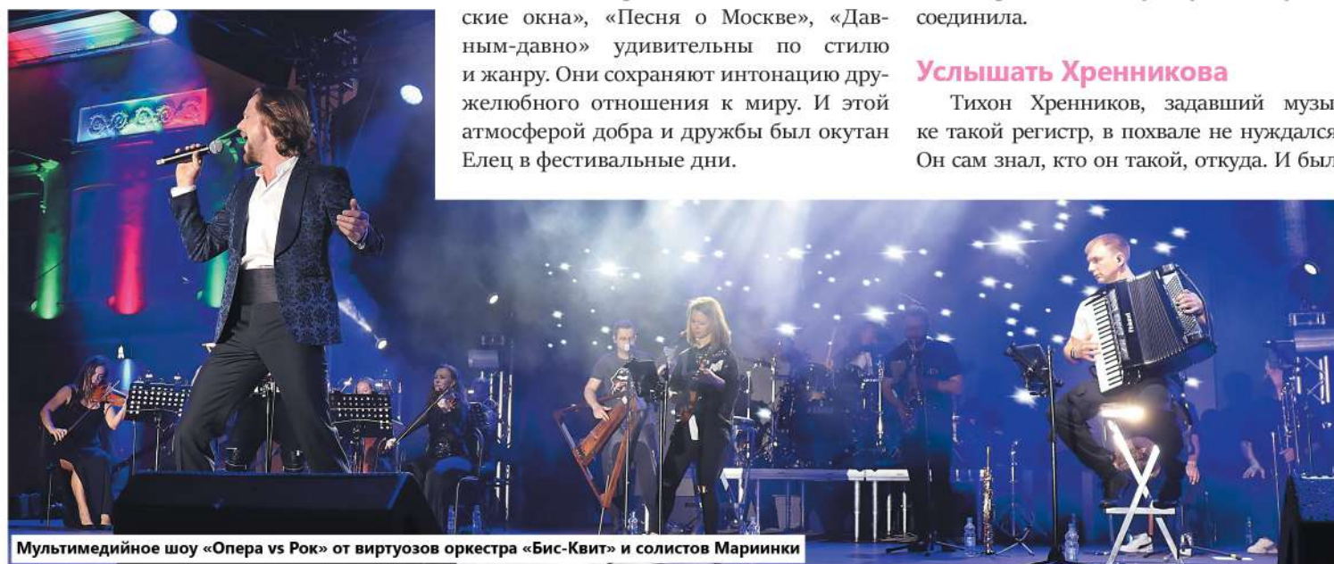
Мультимедийное шоу «Опера vs Рок» от виртуозов оркестра «Бис-Квит» и солистов Мариинки

Тихон Хренников, задавший музыке такой регистр, в похвале не нуждался. Он сам знал, кто он такой, откуда. И был,