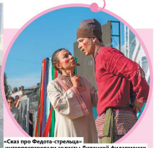
«Сказ про Федота-стрельца» интерпретировали солисты Липецкой филармонии