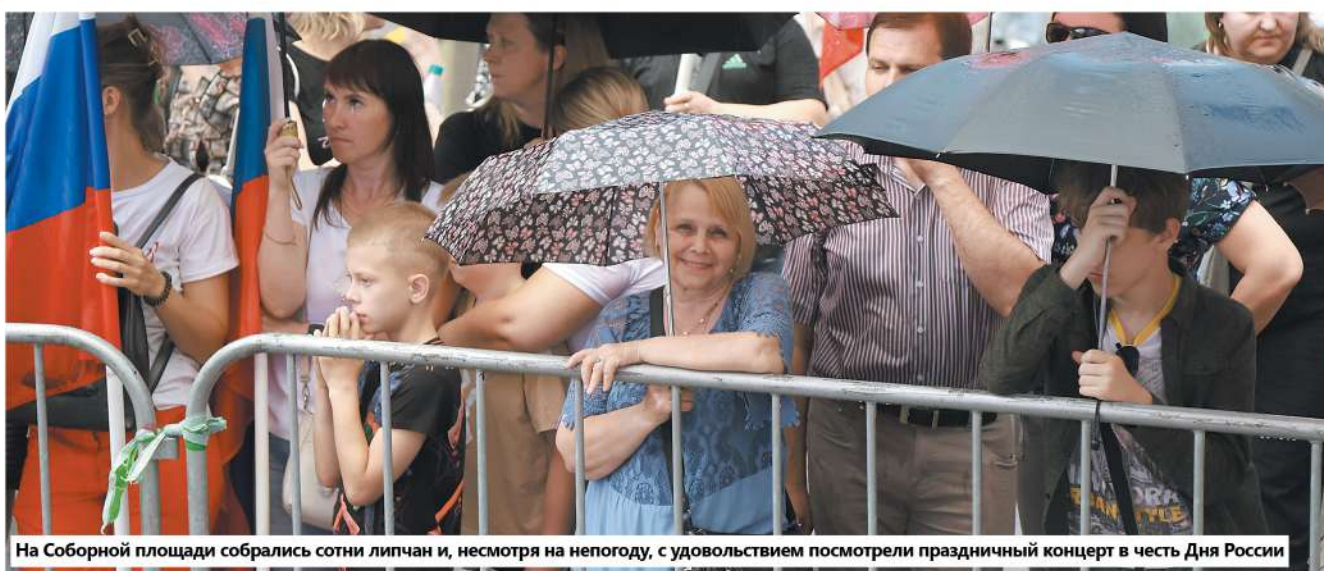
На Соборной площади собрались сотни липчан и, несмотря на непогоду, с удовольствием посмотрели праздничный концерт в честь Дня России

Текст: Кристина Калинина, Марина Ермакова