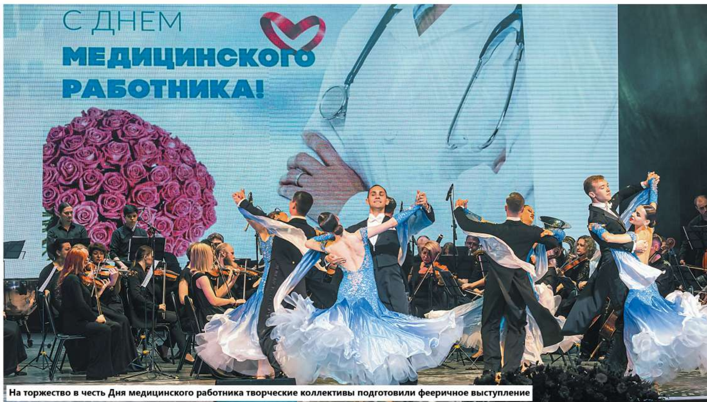
На торжество в честь Дня медицинского работника творческие коллективы подготовили фееричное выступление

В ОБЛАСТНОМ ЦЕНТРЕ КУЛЬТУРЫ, НАРОДНОГО ТВОРЧЕСТВА И КИНО НАГРАДИЛИ ЛУЧШИХ ВРАЧЕЙ