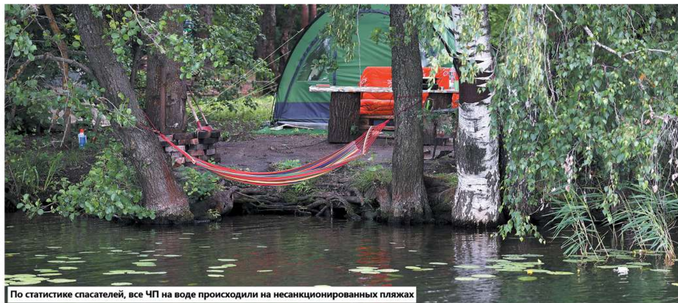
По статистике спасателей, все ЧП на воде происходили на несанкционированных пляжах