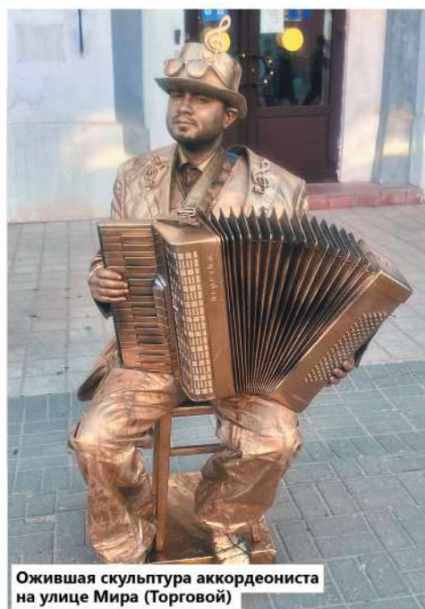
Ожившая скульптура аккордеониста на улице Мира (Торговой)

Да, не было бы музыки Хренникова, не было бы и фильмов. Темы «Московские окна», «Песня о Москве», «Давным-давно» удивительны по стилю и жанру. Они сохраняют интонацию дружеского отношения к миру. И этой атмосферой добра и дружбы был окутан Елец в фестивальные дни.